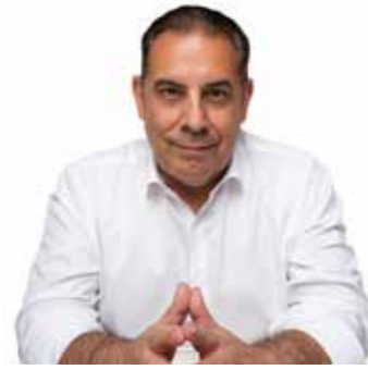
JOSEP MASDEU ISERN ALCALDE DE LA SELVA DEL CAMP